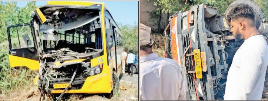
रेवाड़ी। घटना स्थल पर खड़ी क्षतिग्रस्त स्कूल बस, घटना स्थल पर पलटा हुआ कैंटर।

राजस्थान के बहरोड़ स्थित एक प्राइवेट स्कूल की एक बस 20 विद्यार्थियों को भ्रमण कराने के लिए गुरुग्राम के लिए सुबह के समय