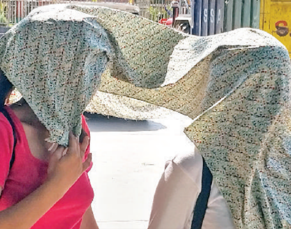
रेवाड़ी। धूप में दूधड़े का सहारा.... महाराणा प्रताप चौक से गुजरती युवतियां।

जल्द बारिश की संभावना नजर नहीं आ रही है। अगले कुछ दिनों तक तापमान में लगातार वृद्धि हो सकती है। शुक्रवार को सुबह के समय आंशिक बादल छाए रहे। दोपहर तक आसमान साफ हो गया। तेज धूप निकलने के बाद मौसम का मिजाज गर्म हो गया। अधिकतम तापमान 2.0 डिग्री सेल्सियस की गिरावट के साथ 41.0 डिग्री सेल्सियस पर आ गया। न्यूनतम तापमान भी 0.2 डिग्री की कमी के साथ 24.8 डिग्री सेल्सियस दर्ज किया गया। हवा में नमी का स्तर 21 प्रतिशत रहा, जबकि 12 किलोमीटर की रफ्तार से हवाएं चलीं। गत वर्ष