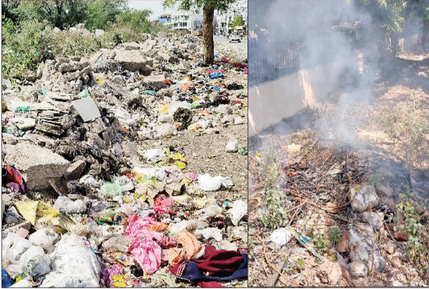
रेवाड़ी। मिनी बाइपास पर कृष्णा नगर के पास डाला गया कचरा व ब्रास मार्केट के तिकोना पार्क में जलता कचरा।