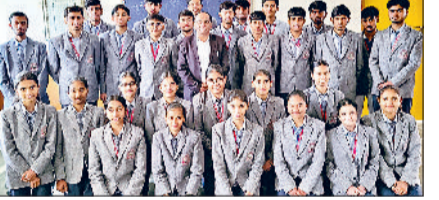
अभिभावकों के सहयोग का परिणाम है।