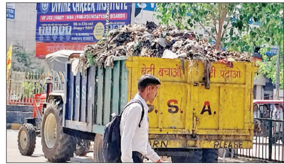
रेवाड़ी। शुक्रवार को महाराणा प्रताप चौक पर खड़ा बिना ढका कचरे का ट्रैक्टर।