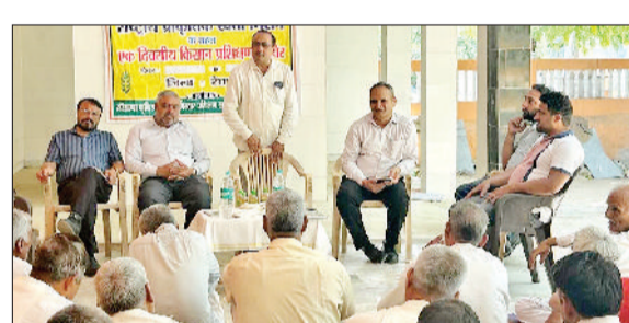
रेवाड़ी। किसानों को जानकारी देते कृषि अधिकारी।