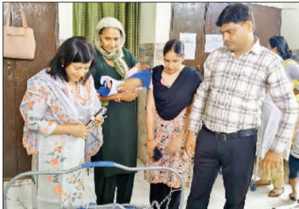
के गरीब और कमजोर वर्गों को सहायता एवं समर्थन प्रदान करने के लिए कार्यरत है।