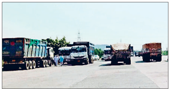
रेवाड़ी। टोल प्लाजा के पास खड़े ओवरलॉड वाहन