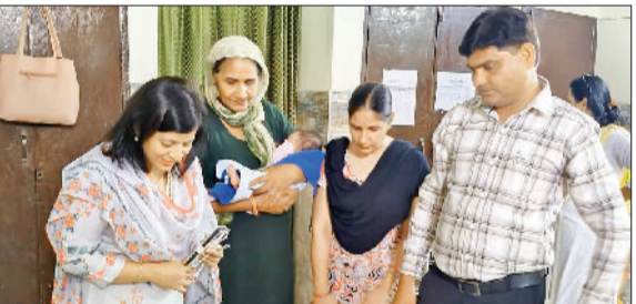
रेवाड़ी। आस्था कुंज का निरीक्षण करते हुए सीजेएम।