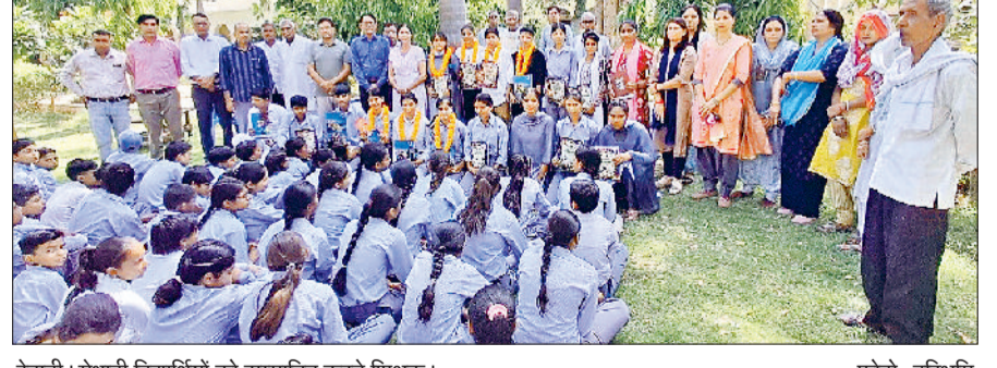
रेवाड़ी। मेधावी विद्यार्थियों को सम्मानित करते शिक्षक।

प्राचार्या ने सभी विद्यार्थियों, स्कूल प्रबंधन समिति के सदस्यों, शिक्षकों और अभिभावकों को बधाई दी हरिभूमि न्यूज ▶▶ कोसली