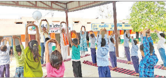
रेवाड़ी। स्कूल में योगाभ्यास करते हुए विद्यार्थी।