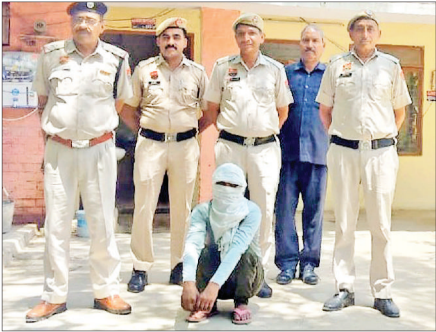
रेवाड़ी। जीआरपी की गिरफ्त में आरोपी।